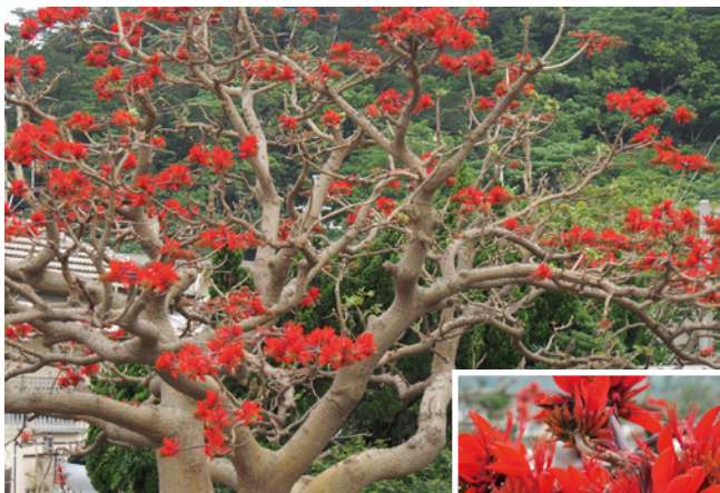
▲塩屋湾のでいごの木。でいごが見事に咲く年は天候が荒れるという伝承が。