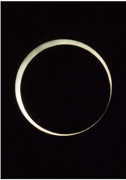
▲茨木市内で観測された金環日食。所長がウキウキで撮りに行きました。

5月21日、日本各地で金環日食が観測されました。金環日食は太陽が月で隠れてリング状に見える現象。次に今回と同じ広い範囲で観測できるのは三百年後だとか。