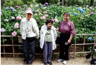
▲万博公園はあじさいの名所としても有名。毎年6月に「あじさい祭り」が催されています。 ◀満開のあじさいを背景に記念撮影。

6月後半、梅雨入り後にしては例年よりさわやかな日が続くなか、万博公園へ紫陽花の花見に行ってきました。しっとりとした色合いのあじさいに心を和ませ、自然豊かな公園内をゆっくりと巡りました。