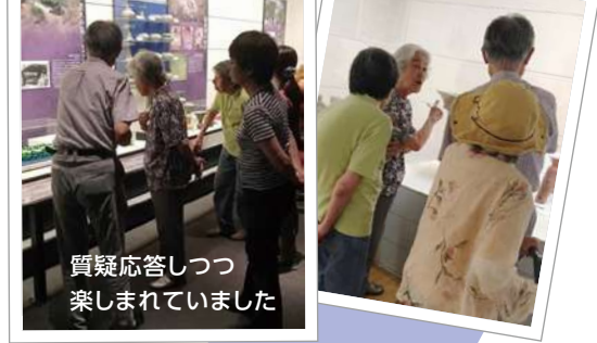
質疑応答しつつ 楽しませていました