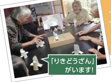
「りきどうざん」 がいます!