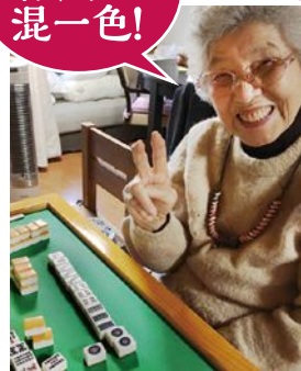
※すごく難しい上がり方です