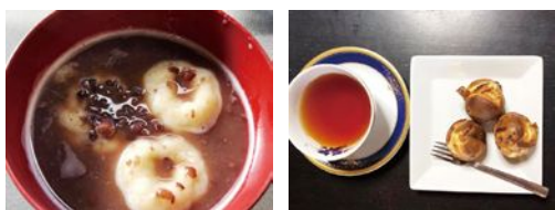
お豆腐だんごのぜんざい 焼きたてベビーカステラ