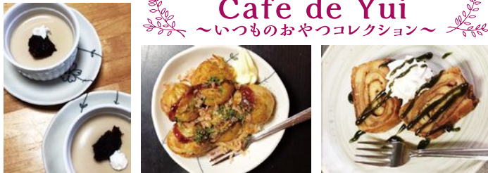
ほうじ茶ラテリン 焼きたてたこやき 手作りバウムクーヘン