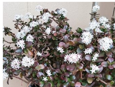
(下)銭の花(カネノ ナルキ)。満開です!