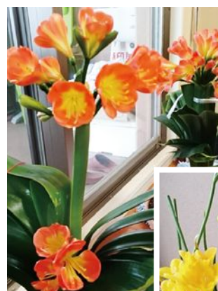
(上)クンシラン。 (右)フリージア。 いずれもご自宅で 育てられています。

を測るかによって変わるのではない んかな?若い看護師さんの場合は 血圧が高くなり、お○ちゃんの場合 合は下がるんですな。そういえば 何年前か、家で測るといつも血圧 が高いのでなじみの内科でおい さんの先生に診てもら うと全く正常。その先生曰 く「ワシも家で測るとヨメ はんが居てるから血圧は 高なる。アンタもそうちゃ うか」ですと。ワタシの場 合、血圧は周りの環境に だいたい左右されるようすな。