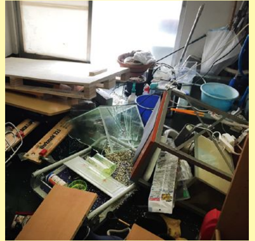
平成30年6月18日 ゆいまーる総持寺事務所