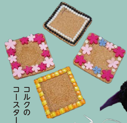
コルクのコースター