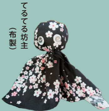
てるてる坊主 (布製)

色とりどりの毛糸を浸かって手編みで作られた「くるくるピエロ」。少しづつ編むので、1つ作るのに1ヶ月程かかるそうです。軍手で作った顔は一体一体少しずつ表情が違います。