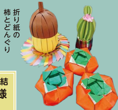
折り紙の柿とどんぐり