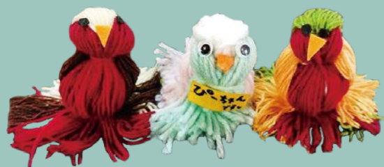
毛糸で作ったインコ