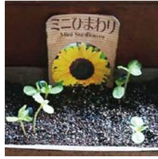
今回はひまわりの 種をまきました