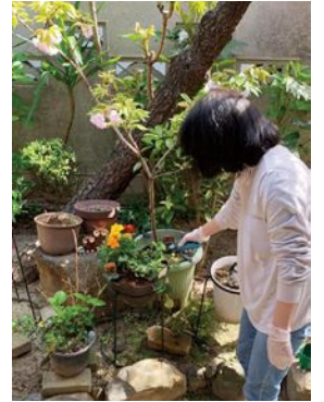
園芸活動として ふだんのお手入れも みなさんで行っています

デイサービス結ホームページ day.yuinet.co.jp Facebookも更新中! @yuimarlday