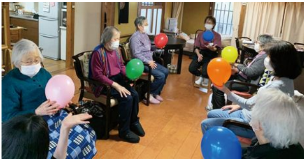
風船を使った運動 バランスをきたえます!