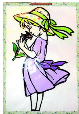
▲デイサービスで出来上がったばかりの可愛い切り絵。