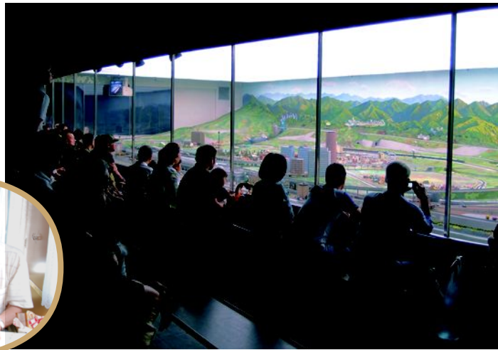
▲パノラマサイズで広がる巨大な鉄道模型。皆さん釘付けです。