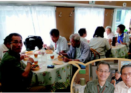
▲昼食は本物の食堂車で。 みんなで駅弁をいただきました。